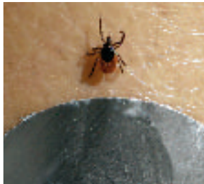
Testanlage: Alu-Plättli miten in behandelter Hautpartie. Was tut die Zecke?

Zum Test: Fünf Testpersonen behandelten eine kreisförmige Testfläche auf dem Schienbein mit dem Zeckenspray und klebten ein Aluminiumplättchen in die Mitte. Da Zecken einen Ort suchen, wo sie ungestört Blut saugen können, versuchen sie, das Metallplättchen zu verlassen. Dazu müssen sie aber über die mit Zeckenspray behandelte Hautregion krabbeln.